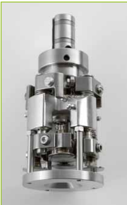
Testina TF 1000/4 con centratore Capping head TF 1000/4 with centering